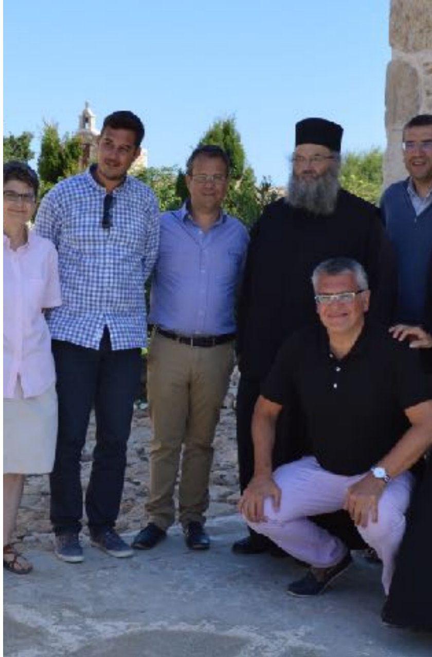
7 η Διεθνής Συνάντηση τῆς Ανάφης, «Τὸ Ρωμαϊκὸ Μιλάνο τῶν Χριστιανῶν», 23-28 Αὐγούστου 2017, Ἱερά Μονὴ Παναγίας Καλαμιώτισσας (Μονὴ Ζωοδόχου Πηγῆς) Ἀνάφης.