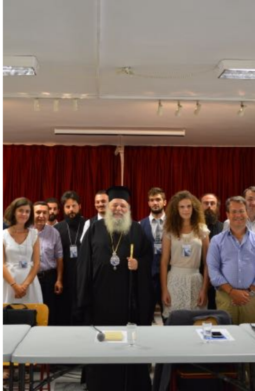
8 η Διεθνής Συνάντηση τοῦ Studium Historicorum Ecclesiasticorum, «Βενετία, ἡ νέα Ἀλεξάνδρεια», 30 Αὐγούστου – 2 Σεπτεμβρίου 2018, Ἱερά Μητρόπολη Παροναξίας, Νάξος.