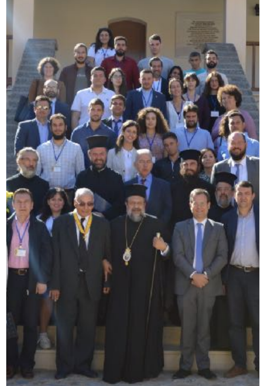
9 η Διεθνής Συνάντηση τοῦ Studium Historicorum Ecclesiasticorum, «Ἡ Ἰωάννεις Παράδοση τῆς Ἐκκλησίας τῆς Ἀνατολῆς», 26-29 Ὀκτωβρίου 2019, Ἱερά Μητρόπολη Μεσσηνίας, Καλαμάτα.