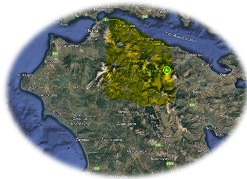
Εικόνα 2-Η περιοχή Αιγαλείας και Καλαβρύτων

Συμπερασματικά, πέρα από τους ειδικούς στόχους του Project, οι ερευνητικοί στόχοι αποτελούν πάντα : α) η διαπίστωση του βαθμού ολοκλήρωσής του β) ο βαθμός και ο τρόπος ενεργητικής συμμετοχής των εκπαιδευομένων και γ) η διακρίβωση παραγόντων που διευκόλυναν ή δυσχέραναν την υλοποίησή του